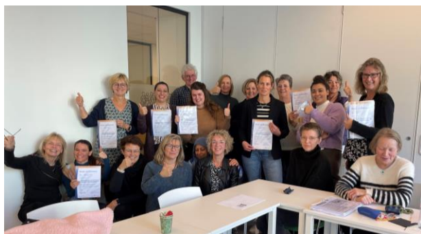
Cursisten Cursus Personeel Ontmoetingscentra 2022

De cursus voor personeel van Ontmoetingscentra was dit jaar weer een groot succes met 24 deelnemers die tot het einde toe enthousiast hebben deelgenomen. Dit jaar werd de cursus deels online (eerste drie lesdagen en vier vervolgbijeenkomsten) en deels fysiek in Amsterdam georganiseerd (twee lesdagen Inleiding psychomotorische therapie en laatste vervolgbijeenkomst). De cursus werd op 29 november afgesloten met feestelijk gebak en uitreiking van de certificaten. Langs deze weg feliciteren we allen cursisten nogmaals van harte!