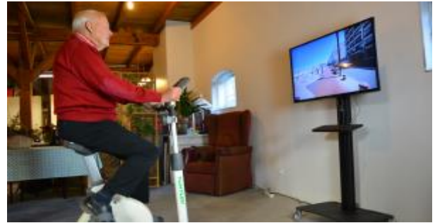
Interactief fietsen

Er is steeds meer erkenning voor de positieve effecten van bewegen op ons lichamelijk en geestelijk welzijn, ook voor mensen met dementie. Toch bewegen mensen met dementie vaak nog te weinig. Zonde, want er zijn genoeg bewegingsactiviteiten die leuk, veilig en geschikt zijn. Een voorbeeld hiervan is exergaming (exercise en gaming), waarbij lichaamsbeweging wordt gecombineerd met cognitieve stimulatie in een spelomgeving.